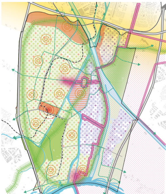
Afbeelding: Visiekaart omgevingsvisie Nieuwegein (2021)