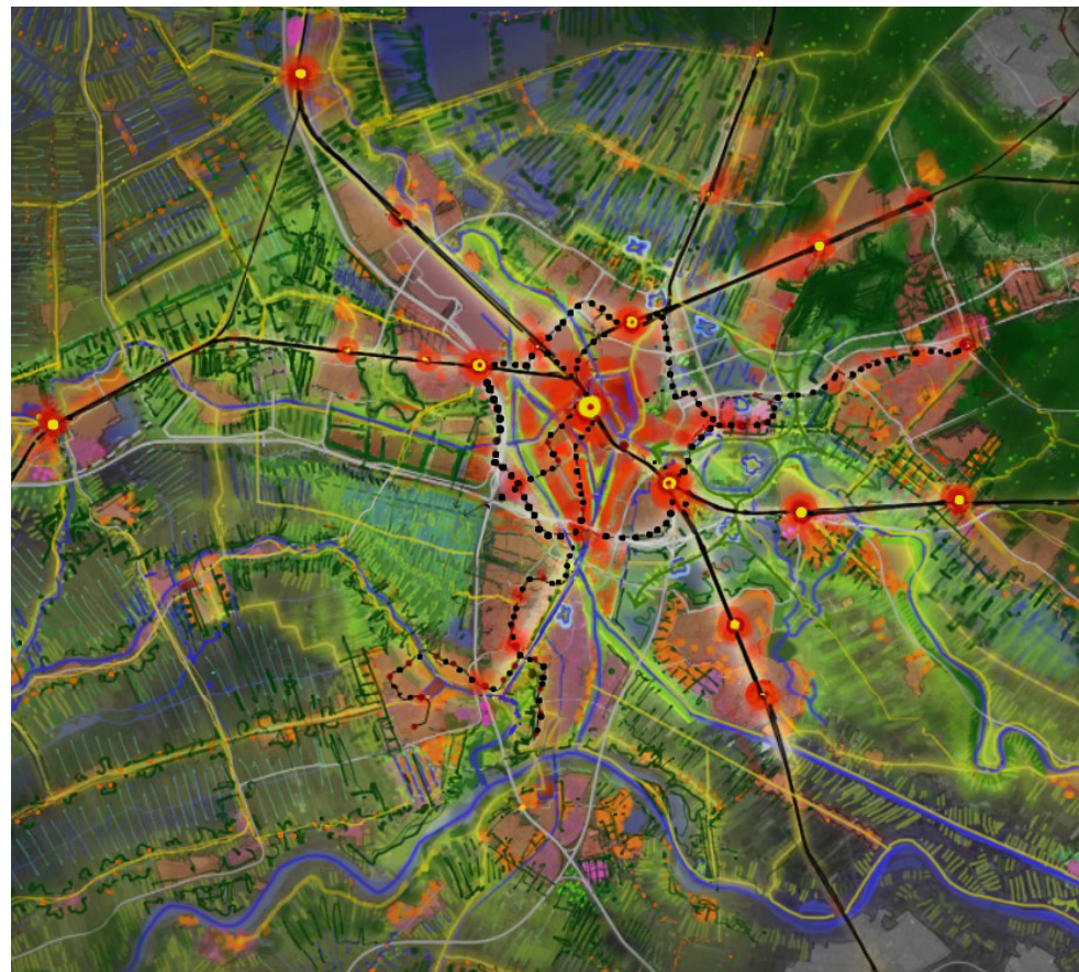
Afbeelding: Visiekaart Integraal Ruimtelijk Perspectief U10 (2021)

snelle tramverbinding tussen Utrecht en Nieuwegein (spaak) te realiseren en snelle HOV-verbindingen op de belangrijkste tangenten (wiel); onder meer met een nieuw station Lunetten Koningsweg en het Utrecht Science Park. De A12 zone wordt gezien als één van de belangrijke gebieden waar een nieuw en levendig stadsdeel kan ontstaan.